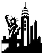
Didascalia della fotografia o immagine

La selezione di immagini ed elementi grafici è un passaggio importante in quanto questi elementi consentono di aggiungere impatto alla pubblicazione.