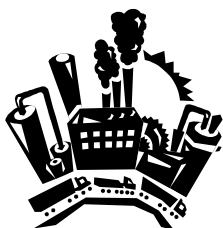
Didascalia della fotografia o immagine

La selezione di immagini ed elementi grafici è un passaggio importante in quanto questi elementi consentono di aggiungere impatto alla pubblicazione.