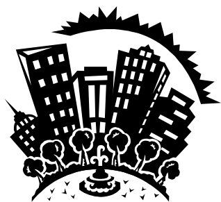
Didascalia della fotografia o immagine

Per occupare tutto lo spazio disponibile, inserire un'immagine ClipArt oppure un altro tipo di elemento grafico.