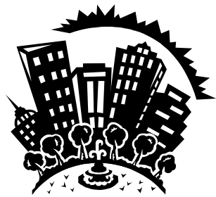
Didascalia della fotografia o immagine

È consigliabile scrivere articoli brevi oppure includere un pro-